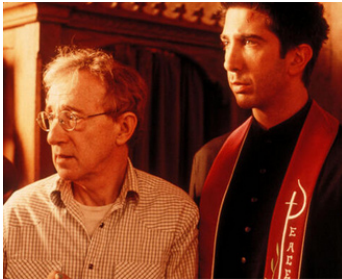
2000 MORCEAUX CHOISIS (Picking up the Pieces) d'Alfonso Arau avec David Schwimmer