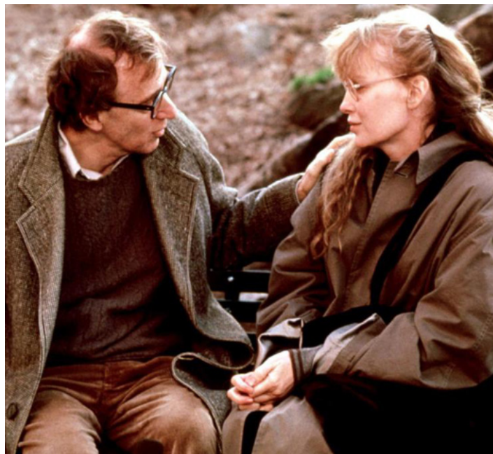
1989 CRIMES ET DÉLITS (Crimes and Misdemeanors) de Woody Allen avec Mia Farrow