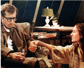
1976 LE PRÊTE-NOM (The Front) de Martin Ritt avec Andrea Marcovici