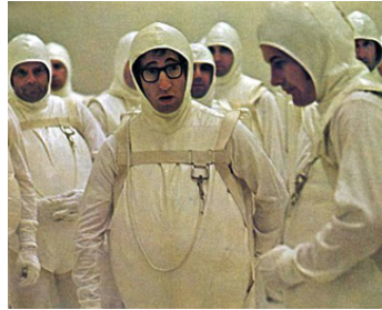
1972 TOUT CE QUE VOUS AVEZ TOUJOURS VOULU SAVOIR SUR LE SEXE de W. Allen