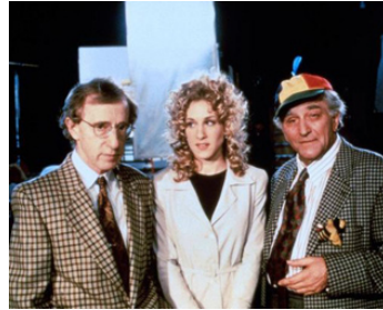
1995 AL ET WILLIE (The Sunshine Boys) de John Erman avec Sarah Jessica Parker, Peter Falk