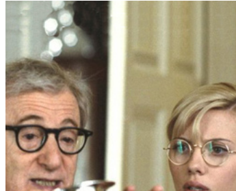
2006 SCOOP (Scoop) de Woody Allen avec Scarlett Johansson