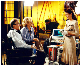
2002 HOLLYWOOD ENDING (Hollywood Ending) de W. Allen avec Tea Leoni, Debra Messing