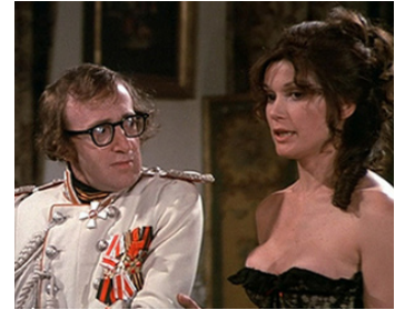
1975 GUERRE ET AMOUR (Love and Death) de Woody Allen avec Diane Keaton