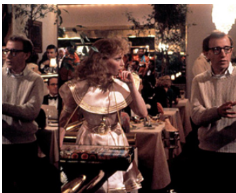
1987 RADIO DAYS (Radio Days) de Woody Allen avec Mia Farrow