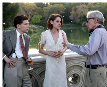
2016 CAFÉ SOCIETY (Café Society) de Woody Allen avec Jesse Eisenberg, Kristen Stewart