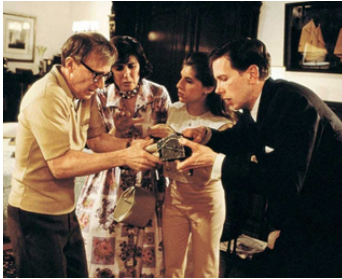
1994 NUITS DE CHINE (Don't drink the Water) de W. Allen avec R. Murphy, R. Stanton