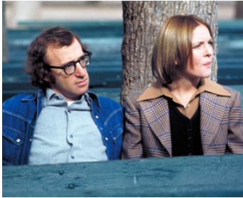
1972 TOMBE LES FILLES ET TAIS-TOI (Play it again, Sam) d'Herbert Ross avec Diane Keaton