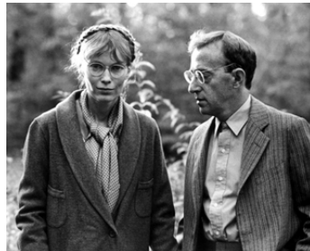
1983 ZELIG (Zelig) de Woody Allen avec Mia Farrow