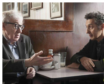
2014 APPRENTI GIGOLO (Fading Gigolo) de et avec John Turturro