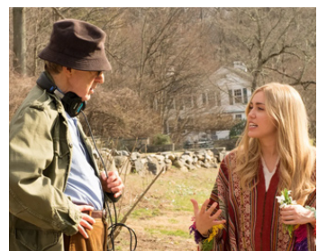
2016 CRISE EN SIX SCÈNES (Crisis in six Scenes) de Woody Allen avec Miley Cyrus