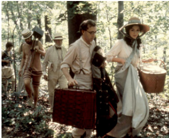
1982 COMÉDIE ÉROTIQUE D'UNE NUIT D'ÉTÉ de Woody Allen avec Mary Steenburgen