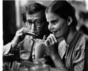
1979 MANHATTAN (Manhattan) de Woody Allen avec Brooke Shields