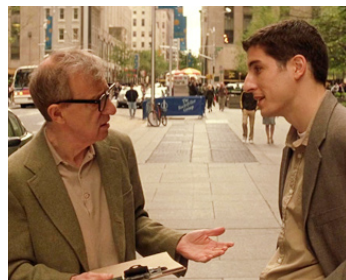
2003 LA VIE ET TOUT LE RESTE (Anything Else) de Woody Allen avec Jason Briggs