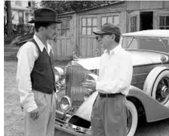
1999 ACCORDS ET DÉSACCORDS (Sweet and Lowdown) de Woody Allen avec Sean Penn