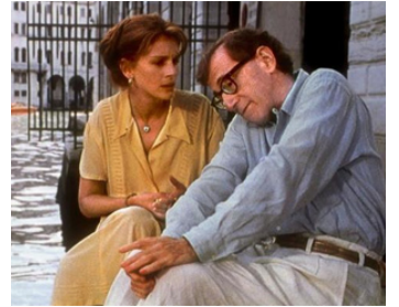
1996 TOUT LE MONDE DIT I LOVE YOU (Everyone says I love you) de W. Allen avec Julia Roberts