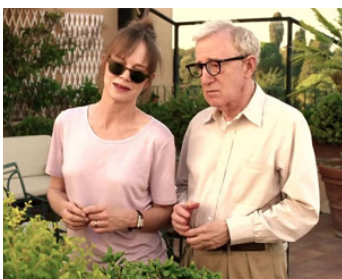
2012 TO ROME WITH LOVE (To Rome with Love) de Woody Allen avec Judy Davis