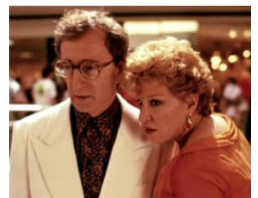
1991 SCÈNES DE MÉNAGE DANS UN CENTRE COMMERCIAL de P. Mazursky avec B. Midler