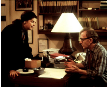
1997 HARRY DANS TOUT SES ÉTATS (Deconstructing Harry) de Woody Allen avec Kirstie Alley