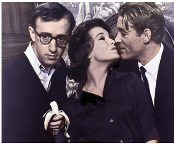
1965 QUOI DE NEUF, PUSSYCAT ? de C. Donner avec Romy Schneider, Peter O'Toole