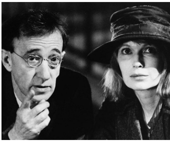
1992 OMBRES ET BROUILLARD (Shadows and Fog) de Woody Allen avec Mia Farrow