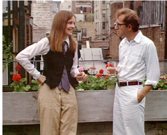
1977 ANNIE HALL (Annie Hall) de Woody Allen avec Diane Keaton