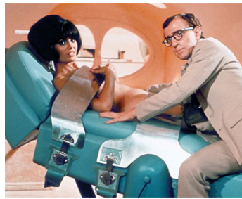
1967 CASINO ROYALE de J. Huston, K. Hughes, D. McGrath, K. Annakin avec Daliah Lavi