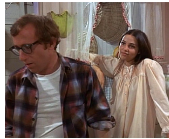
1969 PRENDS L'OSEILLE ET TIRE-TOI (Take the Money and run) de W. Allen avec Janet Margolin