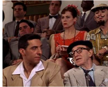
2000 COMPANY MAN de Peter Askin & Douglas McGrath avec John Turturro