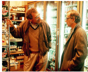
1992 MARIS ET FEMMES (Husbands and Wives) de Woody Allen avec Sydney Pollack