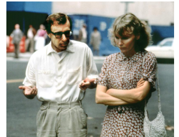
1986 HANNAH ET SES SŒURS (Hannah and her Sisters) de Woody Allen avec Mia Farrow