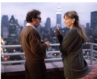
1989 NEW YORK STORIES, Le Complot d'Edipe (Oedipus Wrecks) de W. Allen avec Mia Farrow