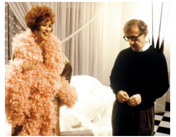
1994 COUPS DE FEU SUR BROADWAY (Bullets over Broadway) de W. Allen avec Diane Wiest