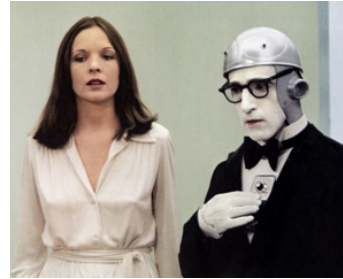
1973 WOODY ET LES ROBOTS (Sleeper) de Woody Allen avec Diane Keaton