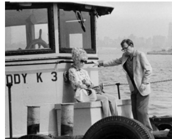
1984 BROADWAY DANNY ROSE (Broadway Danny Rose) de Woody Allen avec Mia Farrow