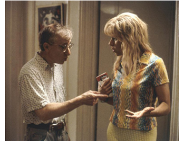
2000 ESCROCS MAIS PAS TROP (Small Time Crooks) de Woody Allen avec Tracey Ullman