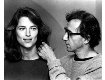
1980 STARDUST MEMORIES (Stardust Memories) de Woody Allen avec Charlotte Rampling