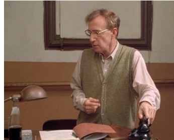
1998 LES IMPOSTEURS (The Impostors) de Stanley Tucci