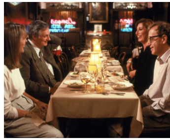
1993 MEURTRE MYSTÉRIEUX À MANHATTAN de W. Allen avec D. Keaton, A. Alda, C. Keener